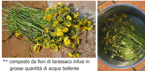
** composto da fiori di tarassaco infusi in grosse quantità di acqua bollente

E' sorprendente osservare come fiori e piante, benefici in determinati momenti e per determinati fini, fioriscano e crescano in abbondanza proprio laddove ve ne sia la massima necessità.