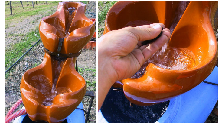
Preparazione biodinamica del "preparato 500" per irrorazione

Quest'anno abbiamo deciso di irrorare con tè al tarassaco, manualmente, le nuove foglioline e i germogli delle viti subito dopo la germogliazione. Si pensa che la pozione rafforzi il tessuto della foglia e riequilibri la popolazione di microrganismi utili per la preparazione della nuova stagione.